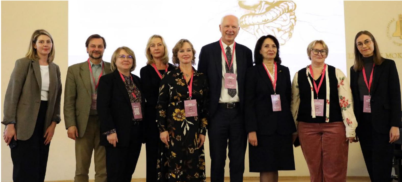
■ Konferencijos organizatoriai ir pranešėjai.