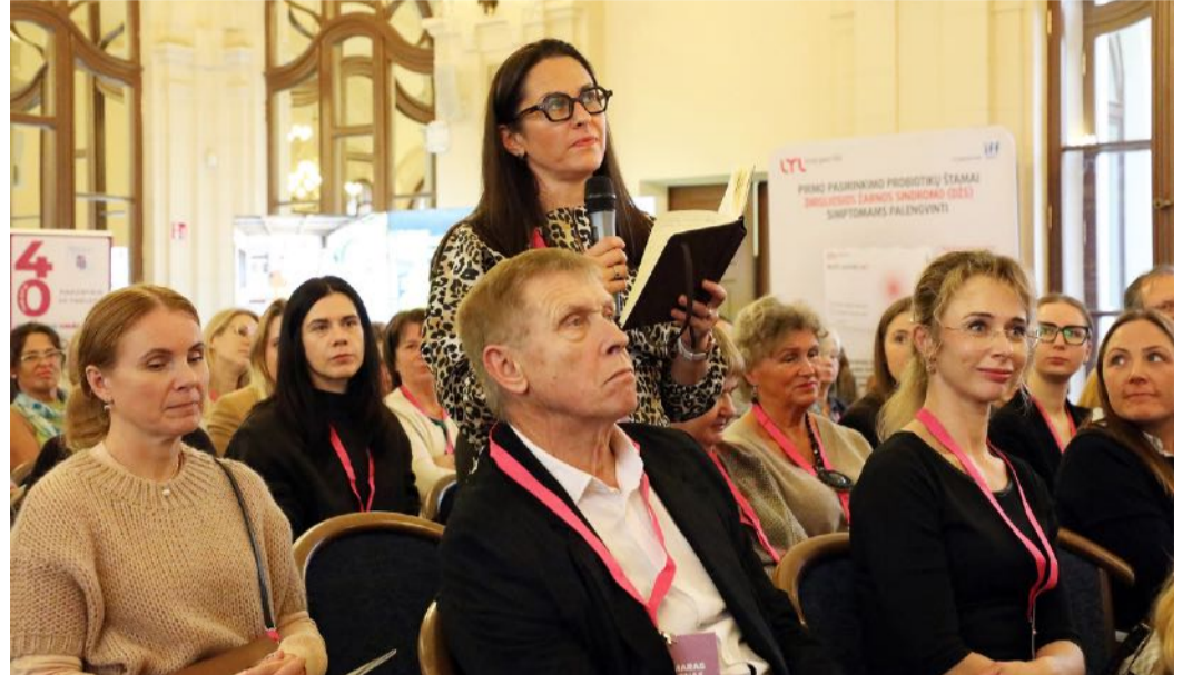
■ Konferencijos akimirkos.