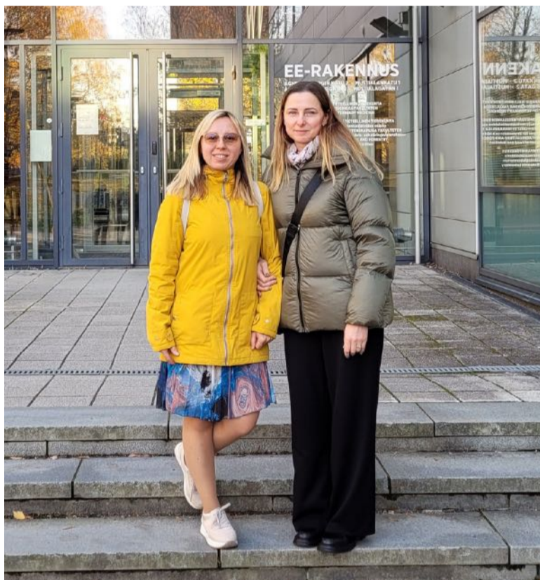
■ Po ekskursijos Helsinkio universiteto Veterinarinės medicinos fakulteto mokymo klasėse.

Daug diskusijų sukėlė klausimai dėl dirbtinio intelekto naudojimo veterinarinės medicinos studijų procese. Vis labiau į visas mūsų gyvenimo sritis įsiliejant dirbtiniam intelektui, susitikimo dalyviai pritarė, kad privalome nustoti bandyti keisti studentus, bet turime stengtis atrasti mokymosi metodus, leidžiančius