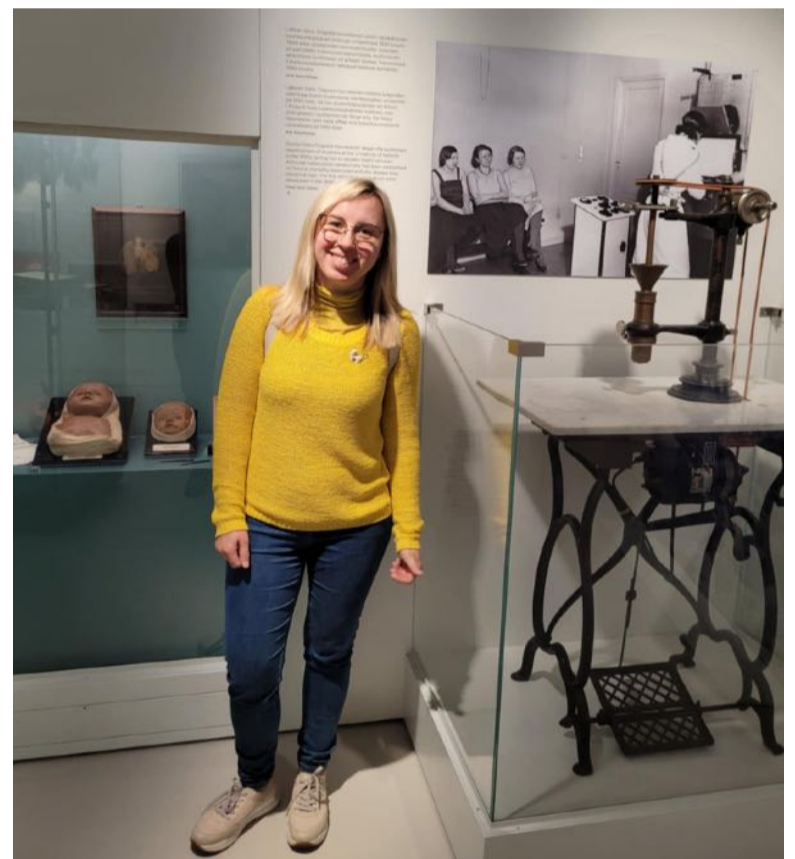
■ Prie vieno pirmųjų vakcinų nuo raupų ruošimo aparato.

pažindino, kokios paslaugos teikiamos šiose ligoninėse, papasakojo, kaip organizuojamas ligoninės personalo darbas ir studentų mokymosi procesas.