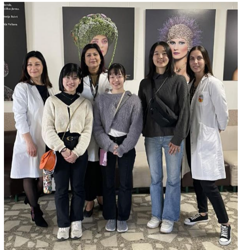
■ Moterų konsultacijoje.

Japonijos studentių viešnagė mūsų universitete buvo ne tik galimybė supažindinti jas su Lietuvos nėščiųjų priežiūros sistema, bet ir puiki proga diskutuoti apie tarptautinius skirtumus bei gerąją praktiką. Tokie tarptautiniai vizitai praturtina studentų akademines žinias, skatina kultūrinius mainus ir padeda plėsti slaugos bei akušerijos specialistų bendradarbiavimą visame pasaulyje.