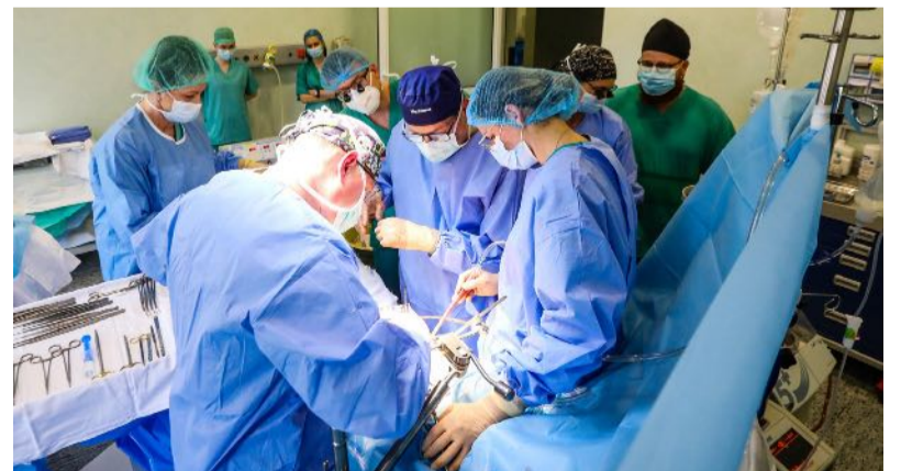
■ Transplantuojamos kepenys.