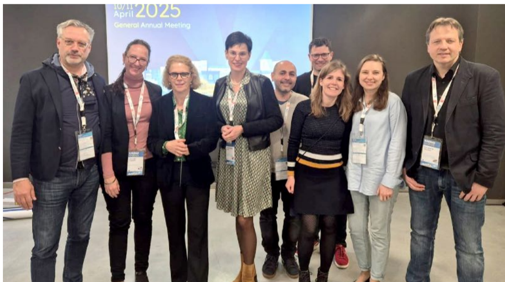
■ ERN-EYE metinio visuotinio susitikimo Kaune organizatoriai.