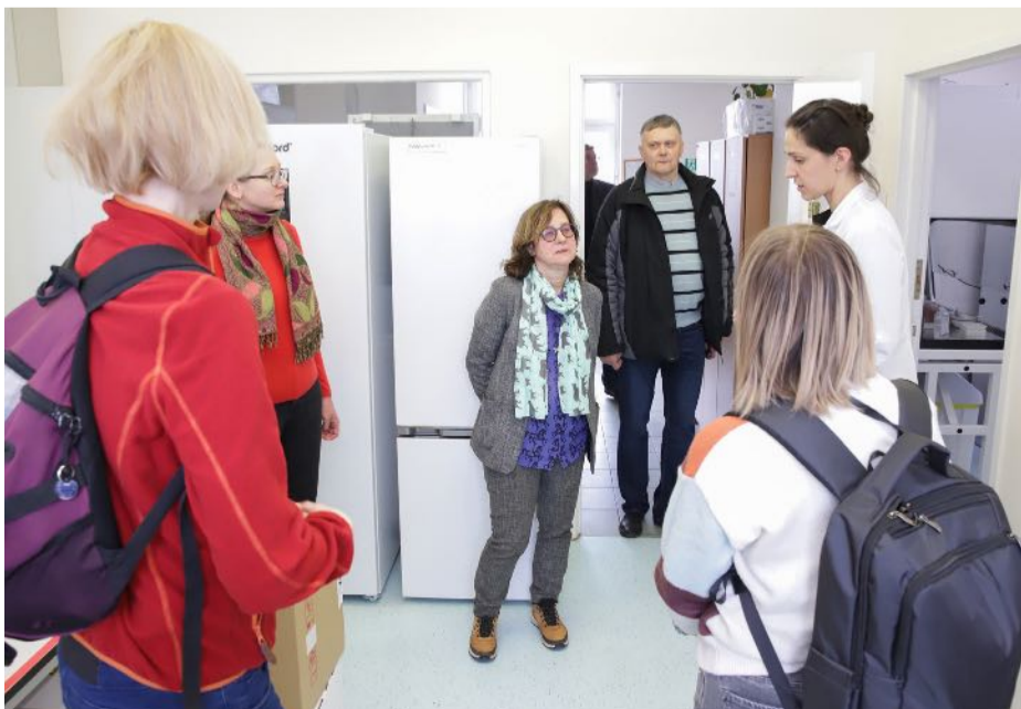
■ VF alumnų apsilankymas Dr. L. Kriaučeliūno smulkiųjų gyvūnų klinikoje.

Taigi renginys įvyko ir pavyko! Buvo gera sutikti savo bendramokslus, kolegas, buvo smagu pasidalyti prisiminimais, naudinga pasisemti žinių. Matome didžiulį tokių renginių poreikį, stiprinančių bendruomeniškumą, kuriančių pasitikėjimą ir emocinį palaikymą, padedančių jaustis veterinarijos bendruomenės dalimi.