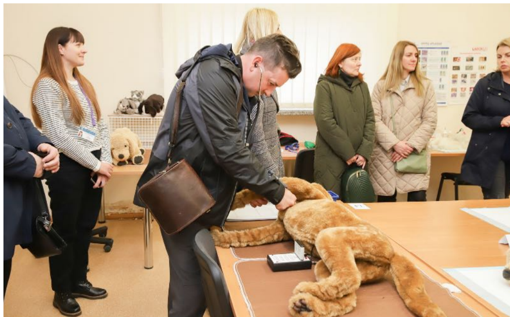
■ VF alumnų edukacinė ekskursija VA Simuliacijos centre.