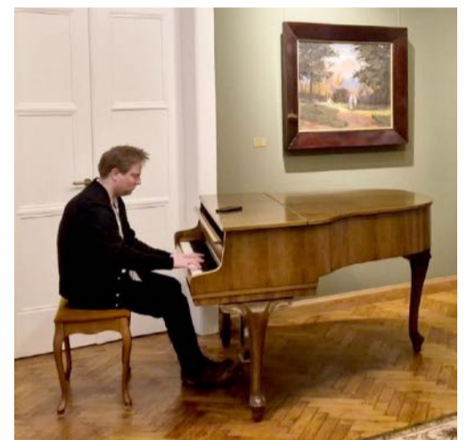
■ Elegantiška ir kamerinė LSMU Emanuelio Levino centro aplinka maloniai džiugino susitikimo dalyvius ir suteikė galimybę atsiskleisti paslėptiems ERN-EYE dalyvių talentams.

į ERN vaidmenį moksliniuose tyrimuose – buvo pateikta informacija apie ERDERA (angl. European Rare Disease Research Alliance ) programą, naujas tyrimų galimybes ir strateginę veidrodinių grupių reikšmę tarpautiniam bendradarbiavimui.