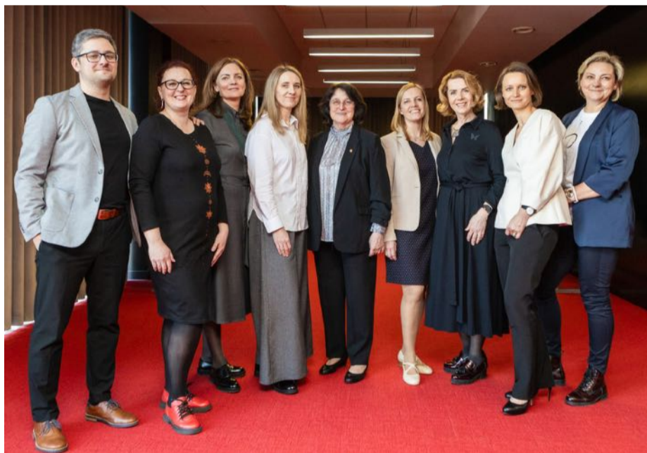
■ Kauno klinikų vaikų neurologai.