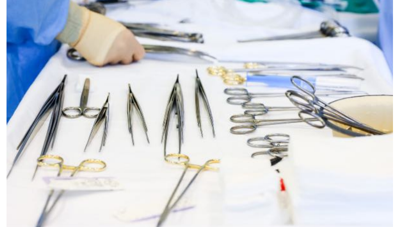
Kauno klinikos – daugiausiai nutukimą koreguojančių operacijų atliekantis centras Lietuvoje. Kasmet apie 400 pacientų kreipiasi į Kauno klinikas dėl nutukimo chirurginio gydymo galimybių. Šias procedūras atlieka patyrę gydytojai chirurgai, kurių kvalifikacija aukštai vertinama ne tik Lietuvoje, bet ir užsienio šalyse.