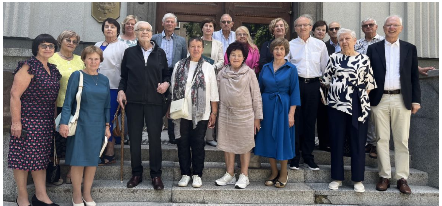
■ Absolventai po 50 metų prie LSMU centrinių rūmų.