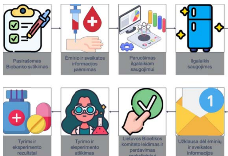
Ėminių ir duomenų tvarkymas Biobanke

Toliau paveikslėliuose pateiktas visas Biobanko veiklos procesas – nuo sutikimo leisti naudoti Tavo ėminius ir sveikatos duomenis pasirašymo iki mokslininkų atliekamų tyrimų bei gautų rezultatų.